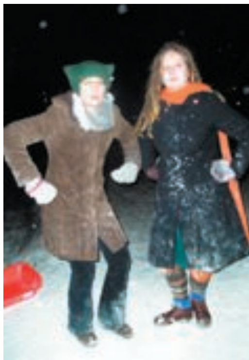
Kiakkoäijikset pois tieltä! Nii!

Meidät tosin palautettiin maan pinnalle hyvin nopeasti: ”Moneenkos teille oli varattu tää kenttä?” Maltahan mielesi, vartti vielä. Voi tsiisuus, kyllä te ehditte sitä kiakkoa pelata joka ilta. Tämä tilaisuus ei puolestaan toistu kauhean usein.