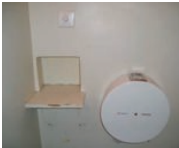
Voisiko joku kertoa, MIKÄ tämä on?

”Lattia hieman epämääräinen, mut suht puhdas (ts. jotain ikitahroja)”