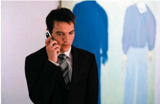
Chris (Jonathan Rhys-Meyers) on päässyt Kalliosta Eiraan.

Match Pointin voi nähdä marxilaisenakin elokuvana, tai ainakin kapitalistisen maailmankuvan kritiikkinä, sillä himoa lukuunottamatta kaikki tunteet kytkeytyvät omaisuuteen ja asemaan, pörssikursseihin ja suhteiden kautta luotuun uraan. Avio-ongelmat ja osakekehitys rinnastuvat luontevasti samassa lauseessa.