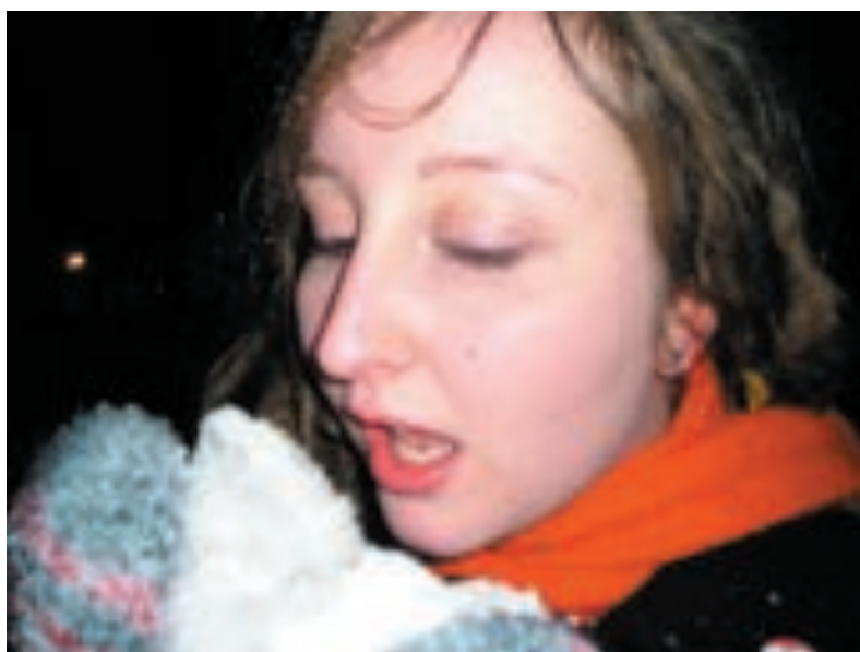
Kielletty (lumi)hedelmä maistuu makoisimmalta. Enää ei äiti tai tarhantäti tule Annan ja täyttymyksen väliin.

No sitä helvettiä, että oli Teema On Ice III: n aika. Luikkarit jalkaan ja jäkisäijikset hevon kuuseen! Emme tyytyneet pelaamaan ringetteä vaan tanssahtelimme musiikin tahtiin ja leikimme ala-asteelta tuttua leikkiä, jonka nimeä en nyt tähän hätään muista. Jotain siinä puhuttiin valkeista varsoista ja palatsissa seisovasta keisarista. (Lapsuudessani Etelä-Pohjanmaalla totuin tosin näihin varsin dadaistisiin sanoihin: ”Rump rump rullaa, reka reka rellaa, seistaus stoppaus sekarol, se vastoin käy, se vastoin käy, annestippaa kallista röönää, esikuva annestippa rösköti rös”. )