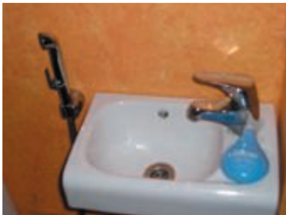
Kalevan sydämessä Pikku Pellervossa odottaa väsynyttä matkamiestä laventelintuoksuinen keidas.

Tämä Kalevan helmi on kantanut noin parin vuoden sisään myös nimiä 'Pub Epeli', 'Pub Sepeli' ja 'Pub Pellervo'. Tapasimme paikassa papiljottipäisen naisen sekä pelasimme lähes käyttämätöntä Trivial Pursuitia vuodelta 1985. Vessa on varustelutasoltaan korkeaa luokkaa, jopa kaunis. Vessasta löytyy montaa laatua paperia, ja jopa saippuaa, oikein laventelintuoksuista Bliwiä.