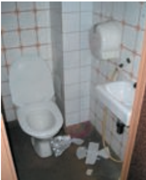
Sema - kun vaadit wc-käynniltä kokonaisvaltaista elämystä

Saippuaa ei ehkä ollut, tai sitten olen niin tumpelo, etten löytänyt sitä. Haroin turhaan piru ties mitä vekotinta lavuaarin yläpuolella. Tällä kertaa toaletissa havaittiin myös lähellä sammumista ainakin puheesta päätellen ollut henkilö.