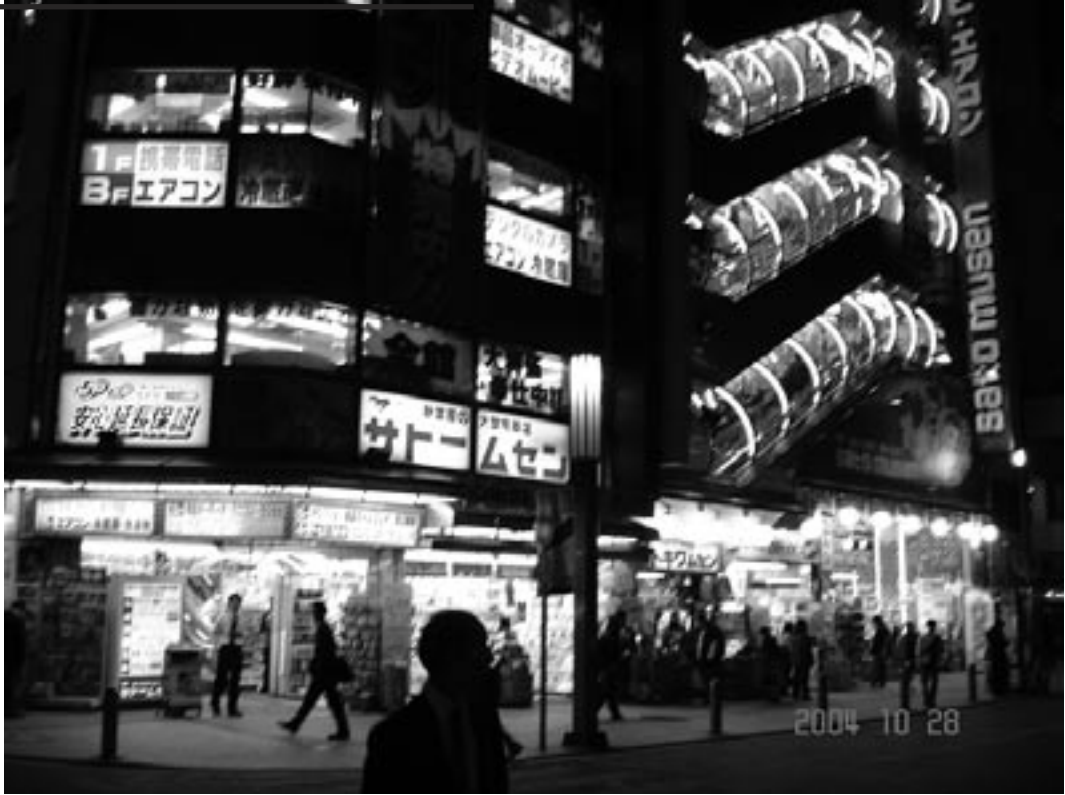
Neonvalojen hurmaa elektroniikan ihmemaassa Akihabara

maan populaarikulttuuri on täynnään pinkkiä, somia otuksia, melua ja täysin kornia roinaa.